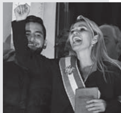
Asume la presidencia interina tras la renuncia de Evo Morales

En estos últimos días, tras el presidente, fueron dimitiendo el resto de las autoridades previstas en la Constitución para sucederle. La senadora Áñez asumió la presidencia con el aval del Tribunal Constitucional. Posteriormente, el nuevo gobierno boliviano convocó a elecciones generales a más tardar en febrero del 2020.