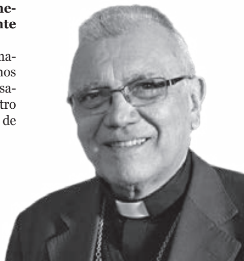
Baltazar Porras Cardozo. Arzobispo de la Arquidiócesis de Mérida y administrador apostólico de la Arquidiócesis de Caracas.

-Card. Porras: En una situación como esta siempre es necesario una negociación y que no se trata que solo un lado dé y el otro no. Es necesario mantener esa postura, sabiendo que en estos momentos en Venezuela hablar de diálogo, o hablar de confianza o de credibilidad en las instituciones oficiales está en su mínimo. En una salida concertada no se trata de eliminar a uno y poner a otro, sino cómo podemos convivir. Lógicamente quienes tengan alguna mayor responsabilidad por crímenes que no prescriben, tendrán que pagarlo. Hace falta una gran prudencia, mucha calma en el sentido samaritano de misericordia y de perdón, para que no sea la violencia ni la muerte la que intente solucionar la situación que vivimos.