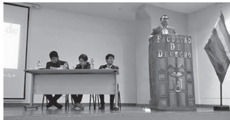
Jóvenes conocieron más de la ética en la política gracias al IESC sede Cusco.