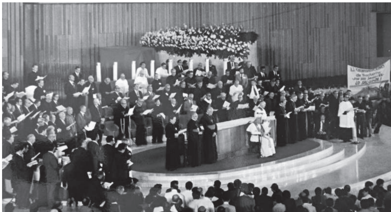
La DSI, elemento esencial de la misión de la iglesia y exigencia para el compromiso por la justicia, orientación específica del laico.

misión de la iglesia, nos viene a liberar de todo este mal con el pecado e injusticia, del pecado personal y del mundo (estructural e histórico), de toda estructura y situación de pecado, opresión y esclavitud.