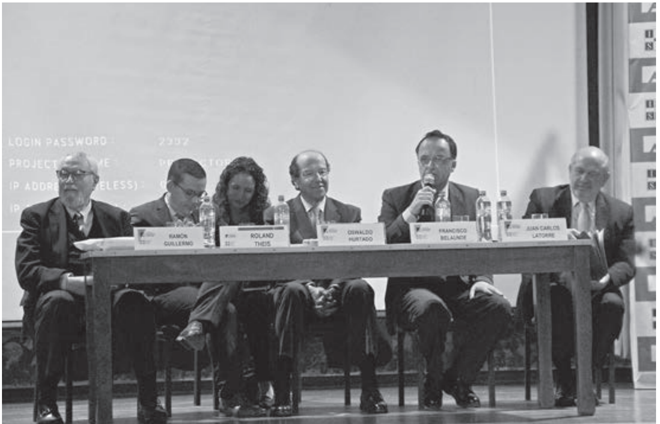
La mesa "Desafíos de las Instituciones democráticas y populismo en América Latina" contó con la participación de destacados expositores.

cedores de la primera guerra mundial, que la paz podía ser solo justicia social. Se ha planteado que se establezca desde un futuro convenio mundial de la OIT la garantía laboral universal, establezca un piso de protección para todos los trabajadores del mundo: reconocer libertades sindicales, a la negociación colectiva, a la no discriminación, no trabajos forzados y rechazo a las peores formas del trabajo infantil.