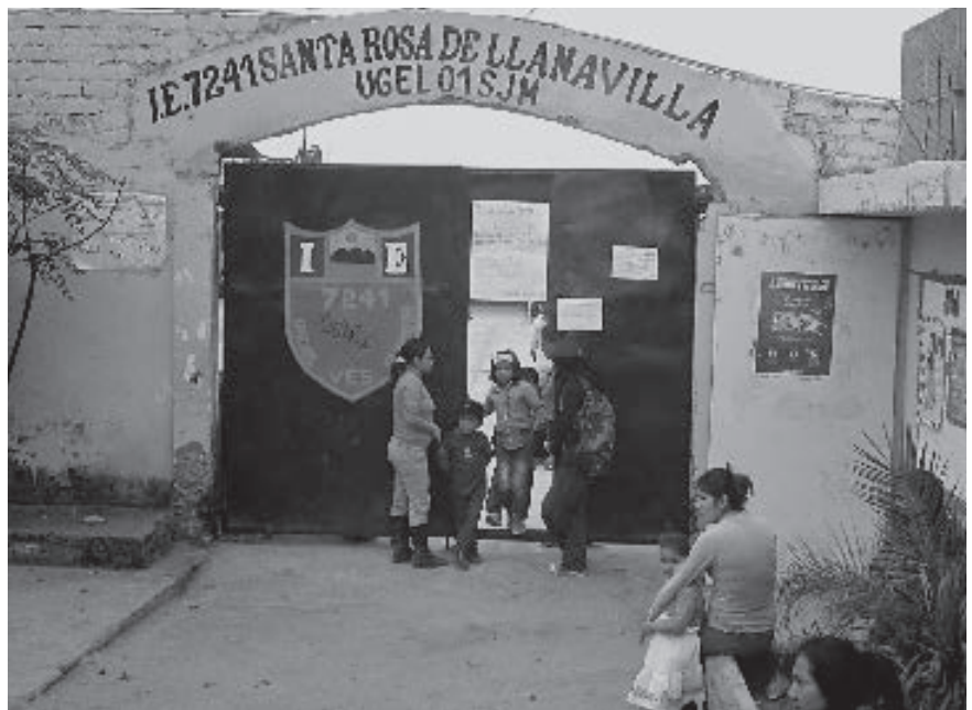
Alumnos del colegio Santa Rosa de Llanavilla' conocen lo que es estar a unos cuantos metros del mar.

Zona roja, o también ubicación desprovista de seguridad ante cualquier desastre natural. Los alumnos del colegio I.E N°7241 'Santa Rosa