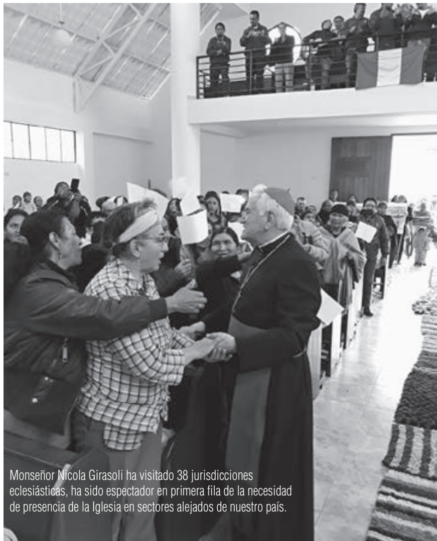
Monseñor Nicola Girasoli ha visitado 38 jurisdicciones eclesíásticas, ha sido espectador en primera fila de la necesidad de presencia de la Iglesia en sectores alejados de nuestro país.

Yo tengo, de verdad, una visión favorable, positiva de la iglesia en el Perú. Visitando, como usted ha mencionado, todas estas diócesis veo una iglesia que está presente con la gente, que está cercana al pueblo de Dios. Claro que hay diferencias entre las poblaciones que se encuentran en la Amazonía, en los vicariatos apostólicos, en la sierra y naturalmente en las diócesis de la costa, pero en todos los lugares se siente este compromiso pastoral de acercarse al pueblo de Dios. Por eso tengo una visión muy positiva, muy optimista, porque veo que se está haciendo un trabajo lo más cercano posible al pueblo. Naturalmente hay que tener presente los muchos desafíos que se encuentran.