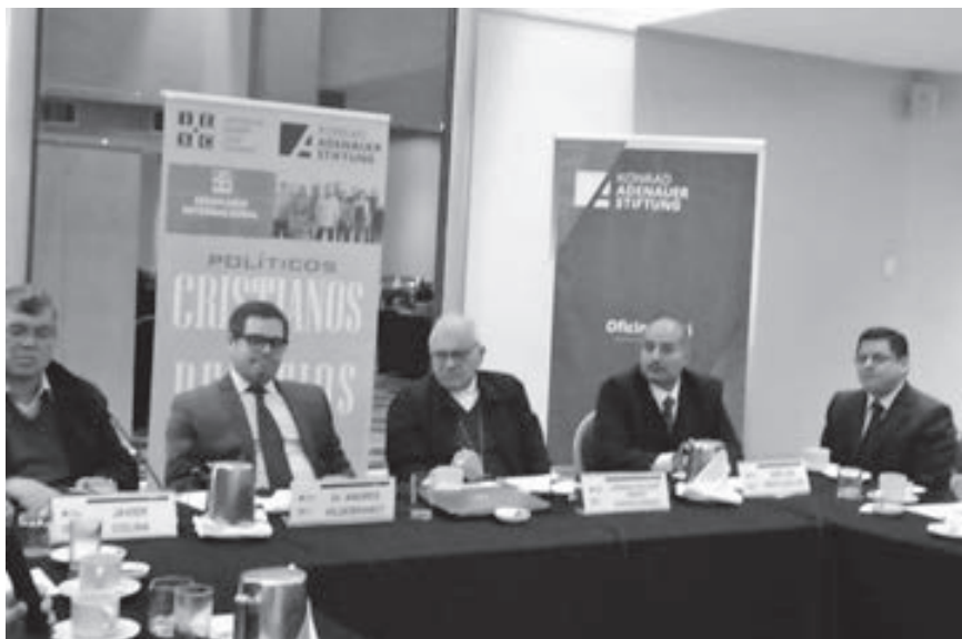
Participación del Cardenal Porras en el foro organizado por el I.E.S.C. y KAS Perú, sobre “La Iglesia ante la crisis en Venezuela”, el 27 de agosto del presente año.

-Card. Porras: Les diría que hay que respetar a los demás y respetar a la gente, y que no podemos estar con el criterio de explotación de la riqueza para unos pocos a costa de muchos otros. Hay que encontrar caminos, que nos permitan tener un mundo mejor